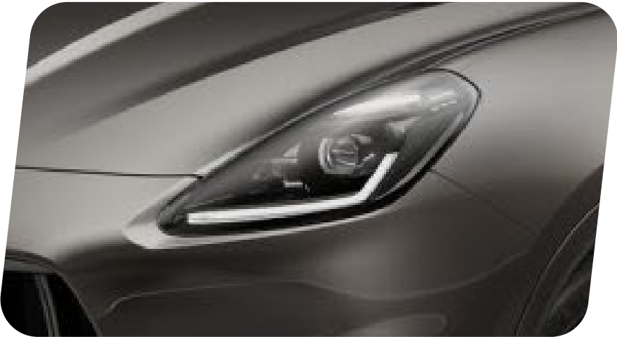
Q5EM Faros – Full LED Matrix adaptativos (sin deslumbramiento – mercado EMEA/CCC)