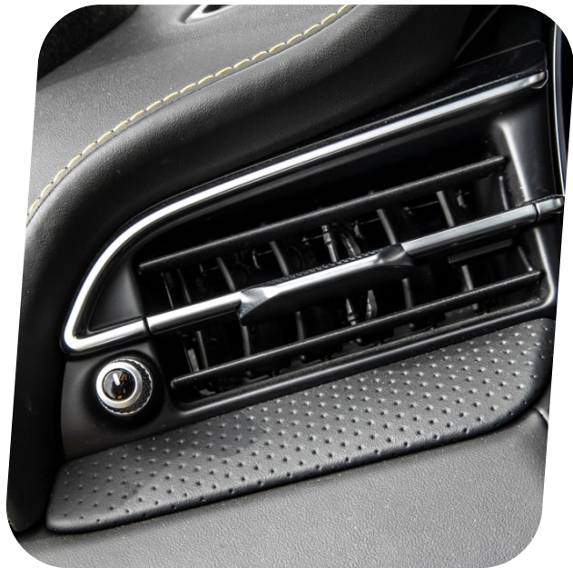
Ventilaciones de aire cromadas [E248]