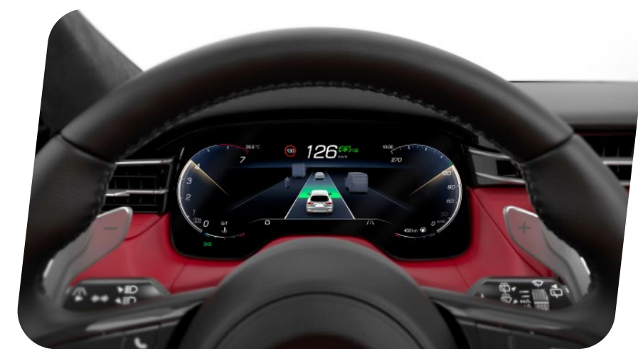
Paquete de asistencia al conductor de nivel 2 [Q2M7]