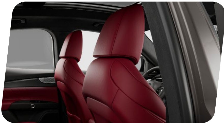
QB8N Interior completo en cuero premium deportivo – Rojo oscuro