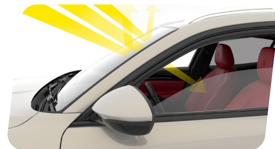
Nuevo paquete de asistencia técnica [QBW8]