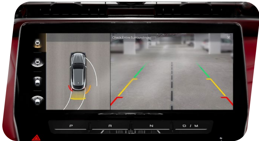
QXAH Cámara de visión 360°