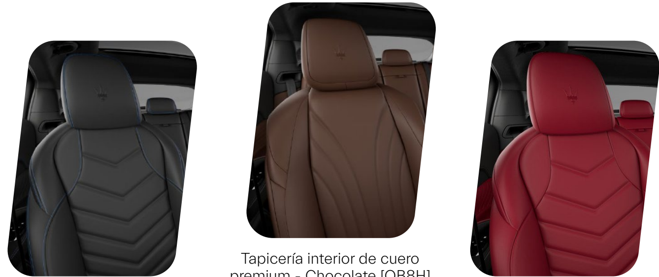
Asientos deportivos premium negros y azules [QJ0F] Tapicería interior de cuero premium - Chocolate [QB8H] Tapicería interior de cuero premium deportivo completo - Rojo oscuro [QB8N]