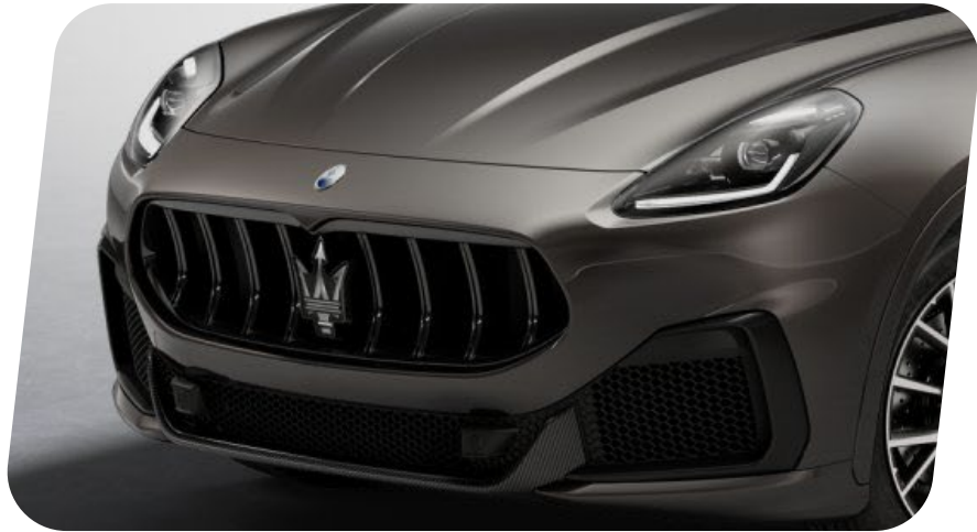
Faros delanteros LED completos [QLM6]