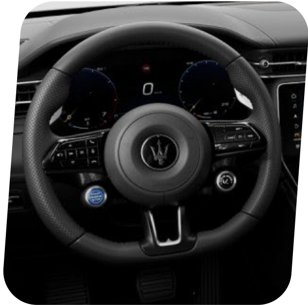
Volante perforado "Negro Forjado" con levas de cambio fijas y botón de arranque azul [QSCL]