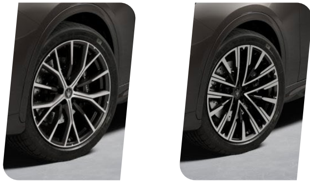
Q35B Rines Crio 21" escalonados Q35K Rines Pegaso forjados 21" escalonados