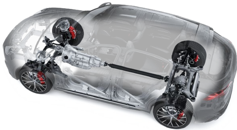
Tracción en las cuatro ruedas Transmisión con diferencial trasero mecánico abierto [E278]