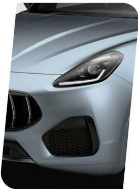
Grigio Lamiera Mate