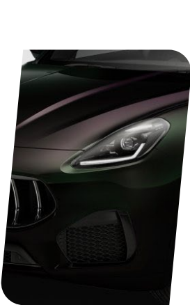
Nero Cometa Brillante