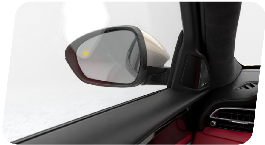
Q3JL Paquete Asistencia al Conductor Nivel 1